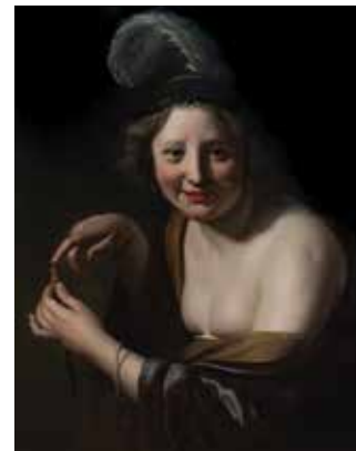
Hendrick Jansz. Ter Brugghen (Deventer, 1588. – Utrecht, 1629.) Alegorija ljubavi , oko 1626. ulje na drvu; 71,4 x 55,5 cm; inv. br. ATM 743