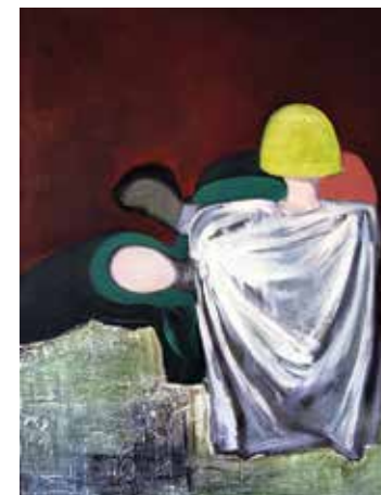
Troglava Veronika, 1971. ulje na platnu, 117 x 133 cm