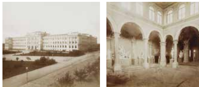
Pogled na zgradu i predvorje Kraljevske zemaljske male realke, danas Muzej Mimaru na prijelazu iz 19. u 20. st. (iz albuma Kraljevska realna gimnazija)

ATM REALITY - riječ je o aplikaciji koja korisnicima nudi mogućnost pogleda u prošlost prostora zgrade Muzeja Mimara. Korištenjem aplikacije otvaraju se stare fotografije iz albuma Kraljevske realne gimnazije datirane u prijelaz s XIX. - og na XX. stoljeće.