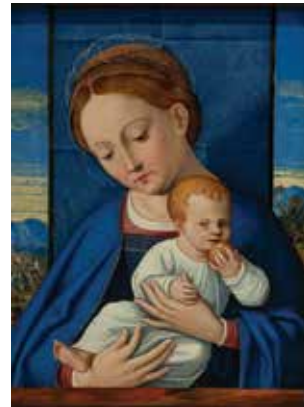
Girolamo da Santa Croce (Bergamo, dokumentiran u Veneciji od 1503. – Venecija, 1556.) Bogorodica s djetetom , sredina 16. st.; ulje na drvu; 28,2 x 22 cm; inv. br. ATM 1954